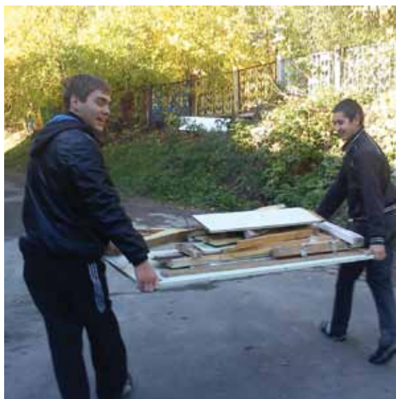
Работа в трудовом отряде

Особое внимание уделяется организации отдыха и трудовой занятости обучающихся в летний период. Среди основных форм занятости – трудоустройство подростков. На протяжении 10 лет с комитетом по делам молодежи ЗГО заключается договор на выполнение ремонтных работ в учебном корпусе. Ежегодно 20 обучающихся ведут подготовку учебного корпуса к новому учебному году.