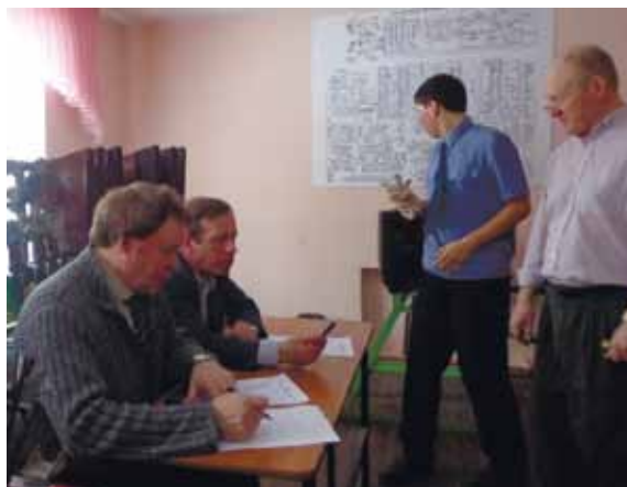
Представители эксплуатационного локомотивного депо Златоуст в жюри конкурса «Лучший по профессии» «Помощник машиниста локомотива»