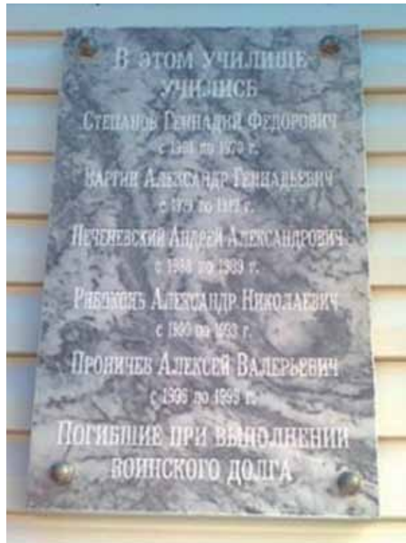
Мемориальная доска памяти выпускников училища, погибших в локальных военных конфликтах

Традицией стало проведение в училище ежегодных мероприятий, таких как День знаний, День города, «Посвящения в первокурсники», «День призывника», конкурсы декоративно-прикладного искусства «Мир моих увлечений», юморина, фестивали самодеятельного художественного творчества, День Победы, конкурс «Мистер и мисс училища» и многие другие. В течение учебного года проводится более 50 культурно- массовых и спортивных мероприятий.