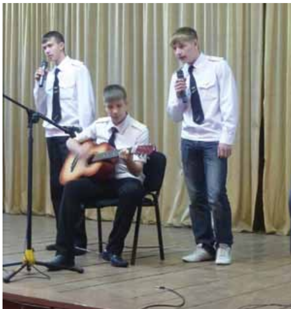
Победители первого этапа фестиваля художественного творчества обучающихся « Я вхожу в мир искусств»

возможность развивать свои профессиональные способности, посещая предметные факультативы, НОУ, ТРИЗ, спортивные секции. Ежегодно число обучающихся ,посещающих факультативы, составляет более 65 %.